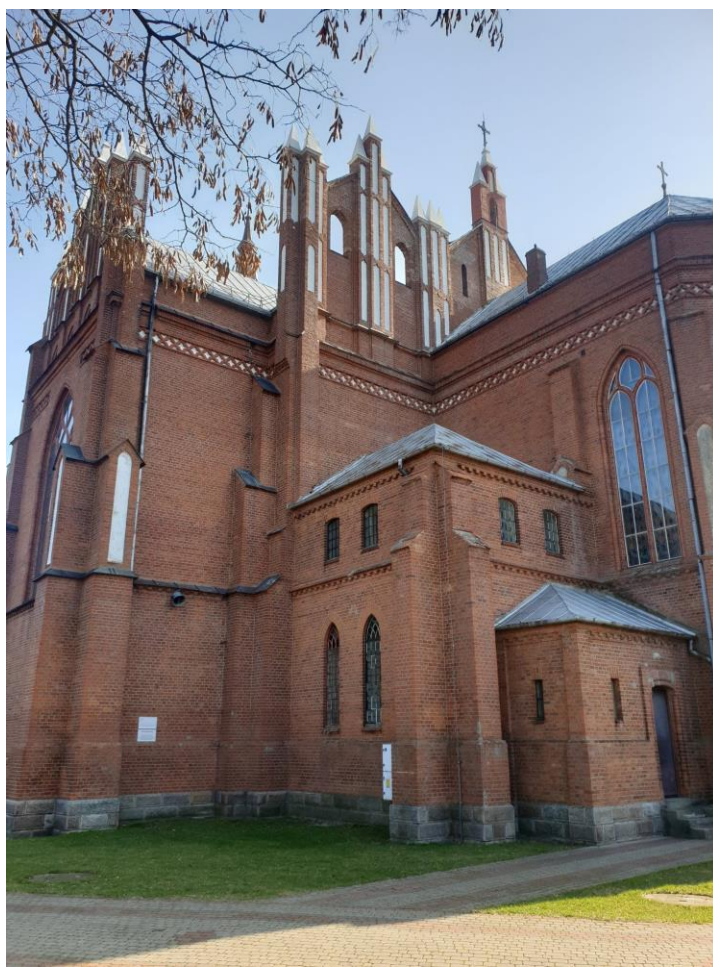
Rysunek 4. Widok kościoła parafialnego w Baranowie od strony zachodniej.