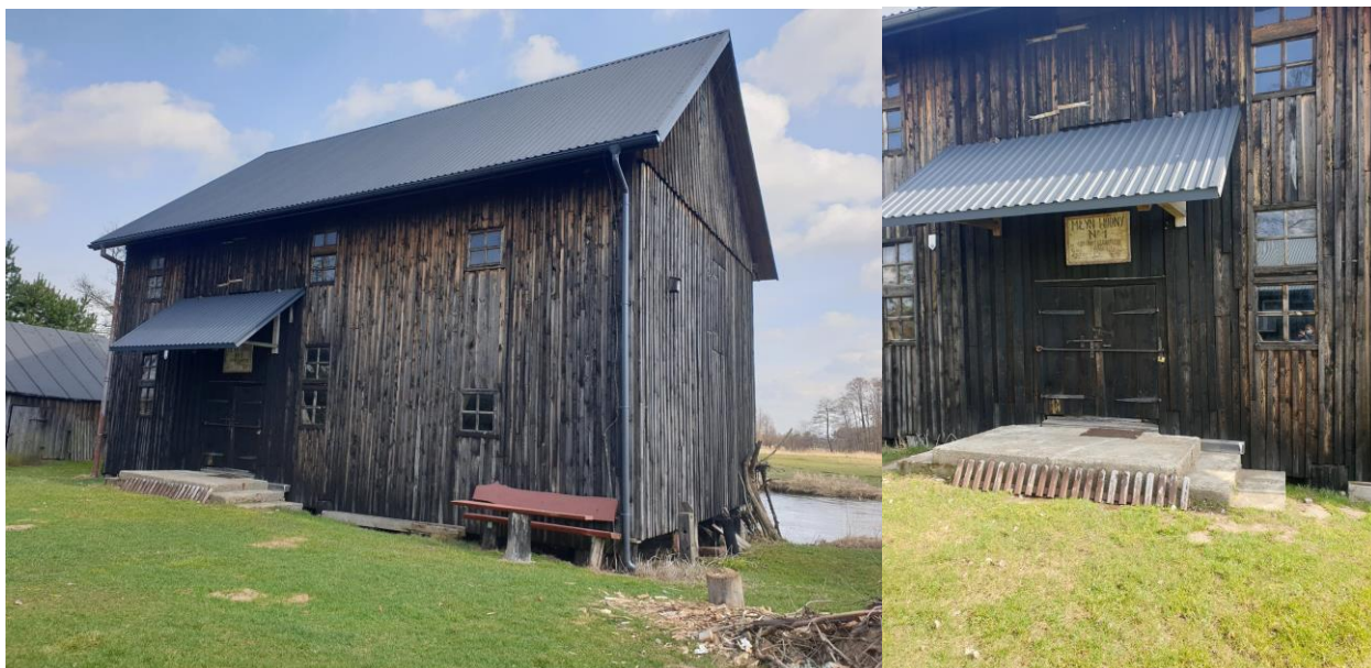
Rysunek 8. Widok na młyn od strony zachodniej.

Zakres i formy ochrony oraz opieki nad zabytkami rejestrowymi przez ich właścicieli i użytkowników reguluje przede wszystkim ustawa o ochronie zabytków i opiece nad zabytkami z dnia 23 lipca 2003 r. (Dz.U. 2021 poz. 710 z późn. zm.) oraz akty wykonawcze do ustawy, w tym m.in. rozporządzenie Ministra Kultury i Dziedzictwa Narodowego z dnia 27 lipca 2011 r. w sprawie prowadzenia prac konserwatorskich, prac restauratorskich, robót budowlanych, badań konserwatorskich, badań architektonicznych i innych działań przy zabytku wpisanym do rejestru zabytków oraz badań archeologicznych.