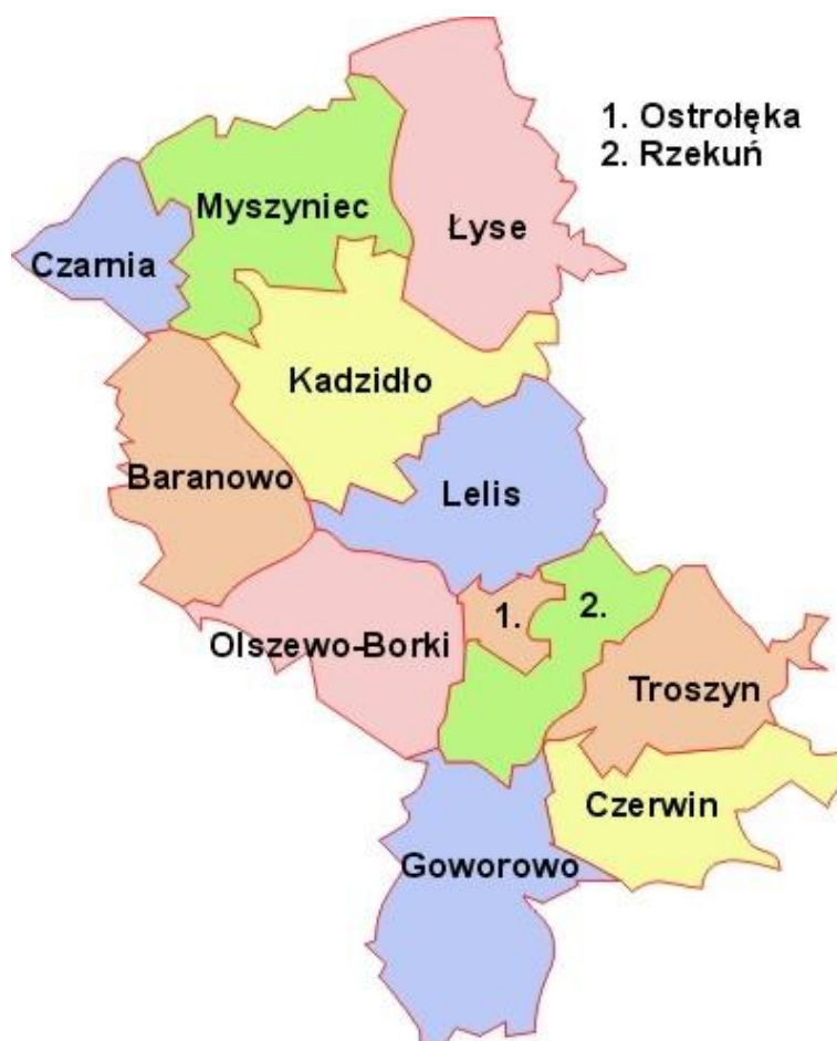
Rysunek 2. Położenie gminy na tle powiatu ostrołęckiego.