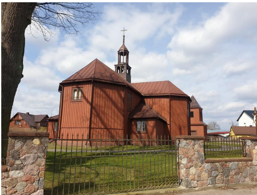
Rysunek 5. Widok kościoła parafialnego pw. Michała Archanioła w Brodowych Łąkach od strony zachodniej.

Dzwonnica wraz ze strefą otoczenia na terenie części dz. nr ew. 181 w granicach istniejącego kamiennego ogrodzenia (Wpis do rejestru zabytków nr A-625 z dnia 22.09.2010 r.)