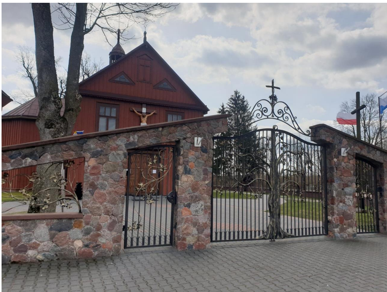
Rysunek 7. Widok na strefę otoczenia kościoła parafialnego pw. Michała Archanioła w Brodowych Łąkach.