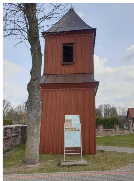
Rysunek 6. Widok dzwonnicy od strony wschodniej.

Dzwonnica to budowla dwukondygnacyjna, wolnostojąca z drewna na podmurówce, szalowana deskami. Przykryta jest dachem czterospadowym i pokryta płytkami z blachy cymowej. W części wschodniej znajdują się drzwi jednoskrzydłowe, obite drewnianymi listwami. Pierwsza kondygnacja oddzielona jest od drugiej daszkiem. Drugą kondygnację stanowią ściany przeprute prostokątnymi otworami. Całość wieńczy krzyż metalowy.